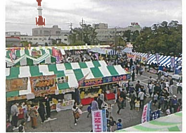
野田市産業祭の様子

伝統と歴史に育まれた野田夏まつり躍り七夕。趣ある竹飾りのほか、市民自らの直接参加できるイベントを多数用意しています。