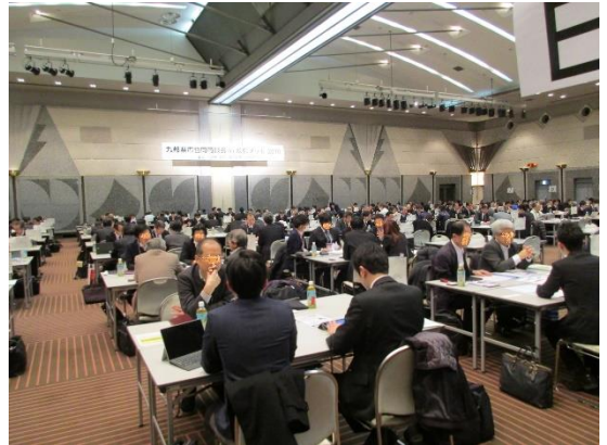
平成30年度に実施した「九都県市合同商談会2019」の商談風景 (会場:幕張メッセ コンベンションホール)

是非、この機会に発注企業としてご参加いただき、協力企業・外注企業の新規開拓や将来の発注に向けた情報収集等の場としてご活用ください。