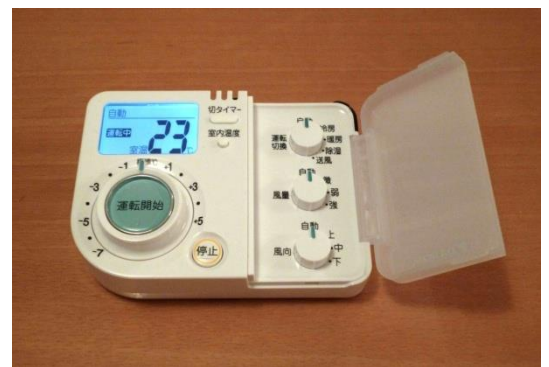
図1 ダイキン工業（株）と共同開発したエアコン用リモコン（らくエア）：2012年度グッドデザイン賞および2013年度 IAUD アワード（プロダクトデザイン部門）受賞

本講演では、ここに記載したものの他にもさまざまな具体例を挙げながら、わかりやすくお話しする予定です。